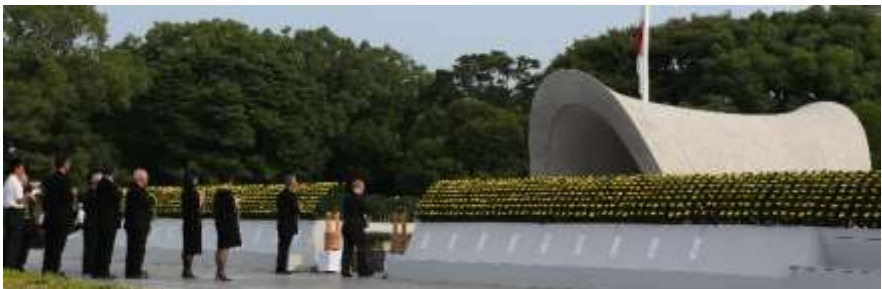
Người dân dâng nước lên bia đá bài vị tại Lễ tưởng niệm hòa bình

Thành phố đang nhắn nhủ “Tuyên ngôn Hòa bình” đến thế giới với hy vọng xóa bỏ vũ khí hạt nhân và đạt được hòa bình vĩnh viễn trên thế giới.