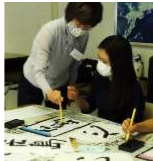
Khung cảnh lớp học tiếng Nhật tại Trung tâm văn hóa Hòa bình Hiroshima