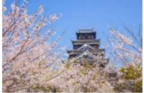
Lâu đài Hiroshima và hoa anh đào vào mùa xuân

Thời gian nóng nhất là tháng 8, cũng có những ngày nhiệt độ vượt quá 35°C. Độ ẩm cao và thời tiết nóng ẩm. Có nhiều ngày thời tiết dễ chịu vào mùa xuân và mùa thu.